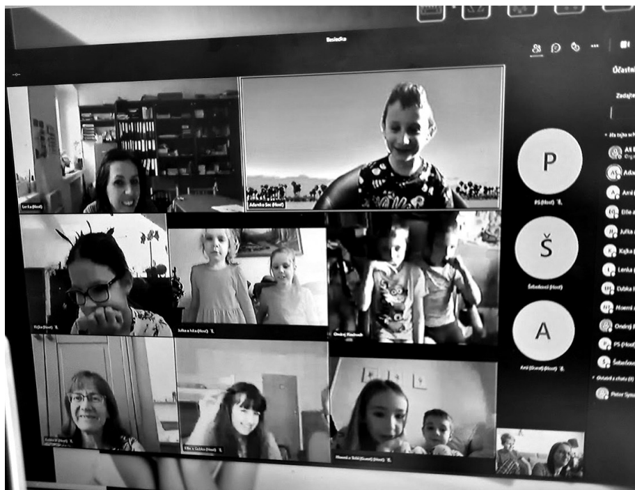
Detská besiedka online