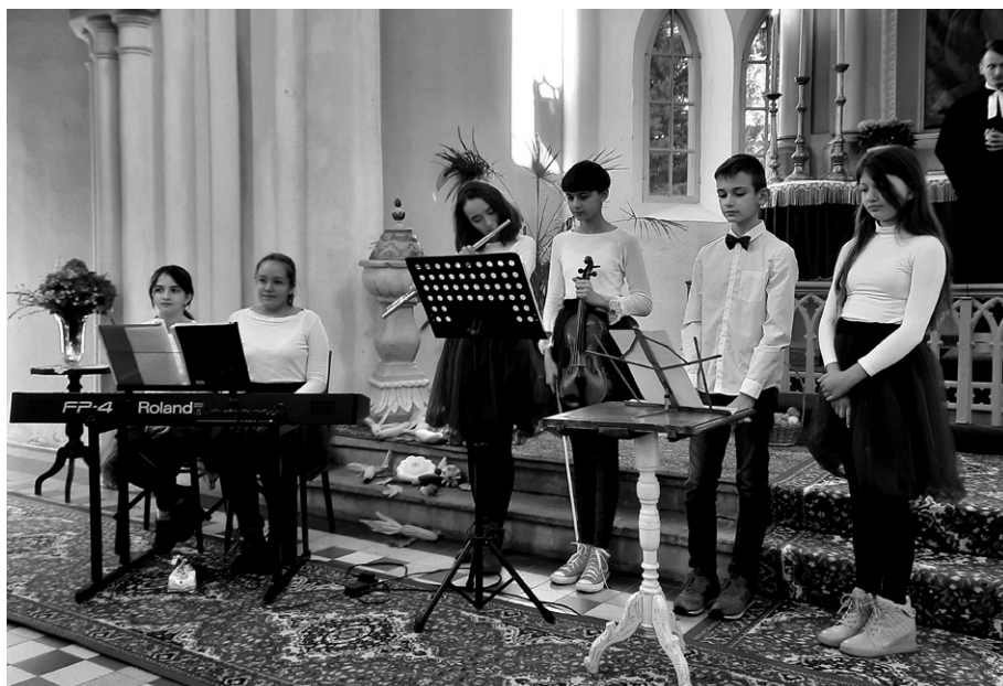
Vystúpenie v Bátovciach

Akoby zázrakom sa nám podarilo pripraviť a užiť si koncom októbra 2021 víkendové sústreďenie orchestríka v CZ Jablonožovce. V útulnom prostredí sme naše nácviky zamerali na prípravu piesní pre adventné a vianočné obdobie, spoločne sme sa schádzali a zamýšľali nad Božím slovom, išli na výlet do Brhloviec, zažili pravú jesennú opekačku a večer zrelaxovali pri spoločnom filme. Na záver sústreďenia orchestrík poslúžil na SB v CZ Bátovce, kde sme tiež využili príležitosť prihovoriť sa domácemu cirkevnému zboru a v krátkosti predstaviť činnosť nášho telesa. Realizáciu tohto sústreďenia berieme ako zázrak a dar zároveň, pretože sme už niekoľkokrát plánovali prežiť spoločný orchestríkovský víkend, avšak kvôli nepriaznivej pandemickej situácii sme museli naše plány odložiť.