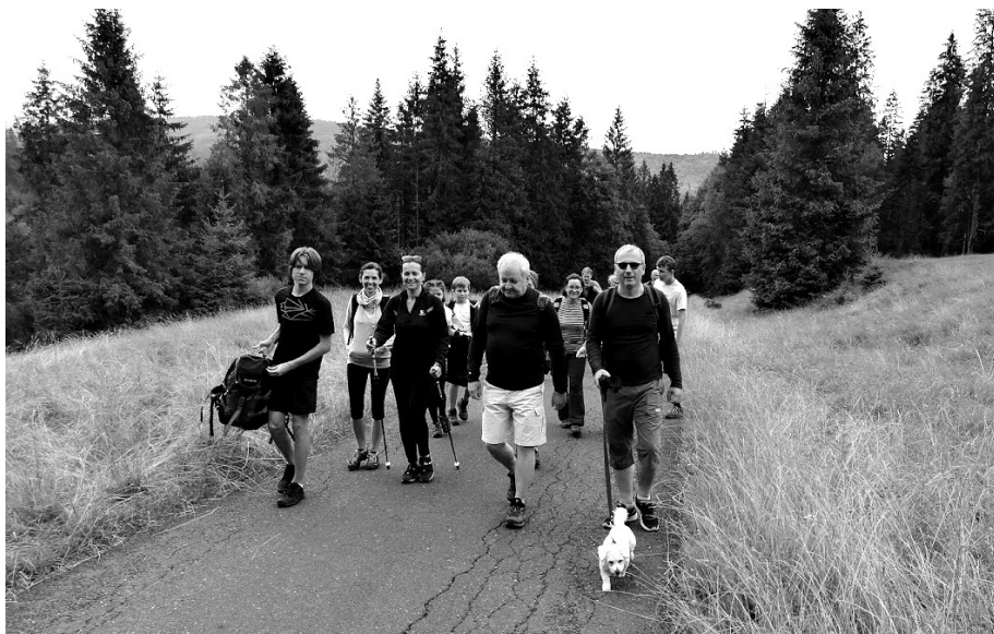
Túra v Juráňovej doline