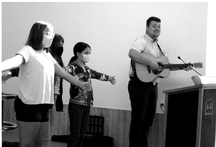
Služby Božie v našom zbere