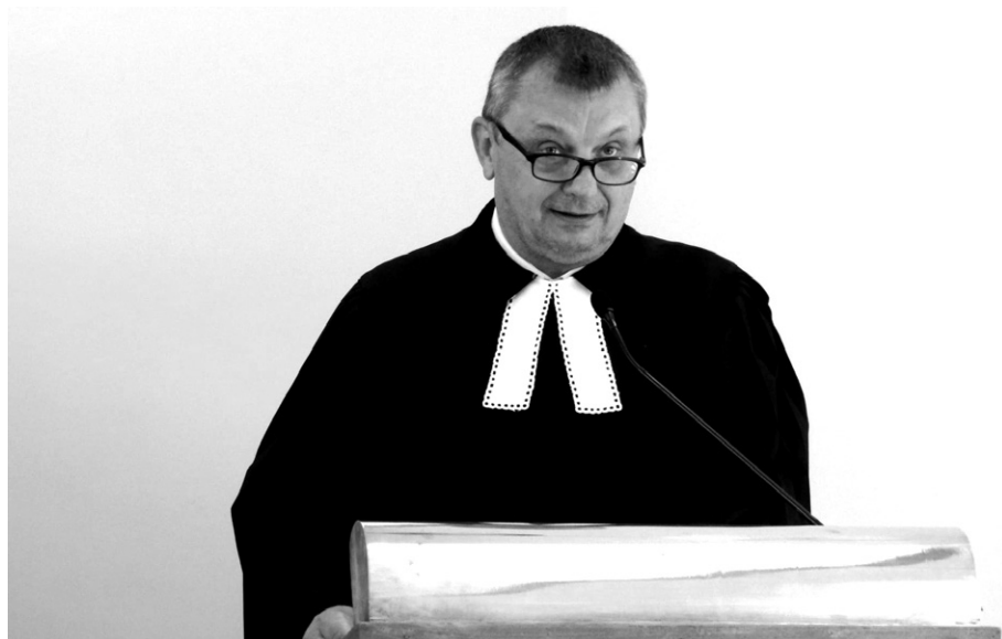
Kázeň brata farára Kolesára

Služby Božie sa po zvyšok roka mohli vykonávať prezenčne, ale iba za obmedzených podmienok, ktoré sa menili podľa aktuálnej pandemickej situácie. Keďže sa podmienky najmä k záveru roka menili takmer každý týždeň, vyžadovalo si to od nás značnú flexibilitu a schopnosť rýchlo zareagovať na vzniknutú situáciu.