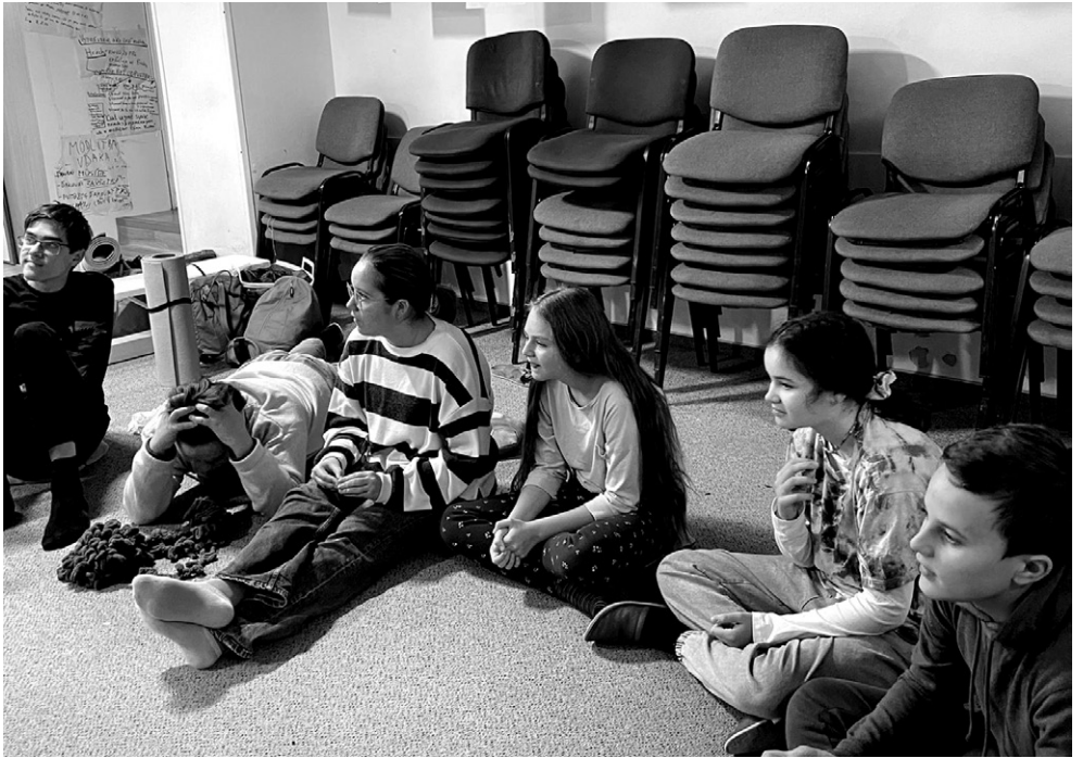
Noc dorastu na fare, november 2022