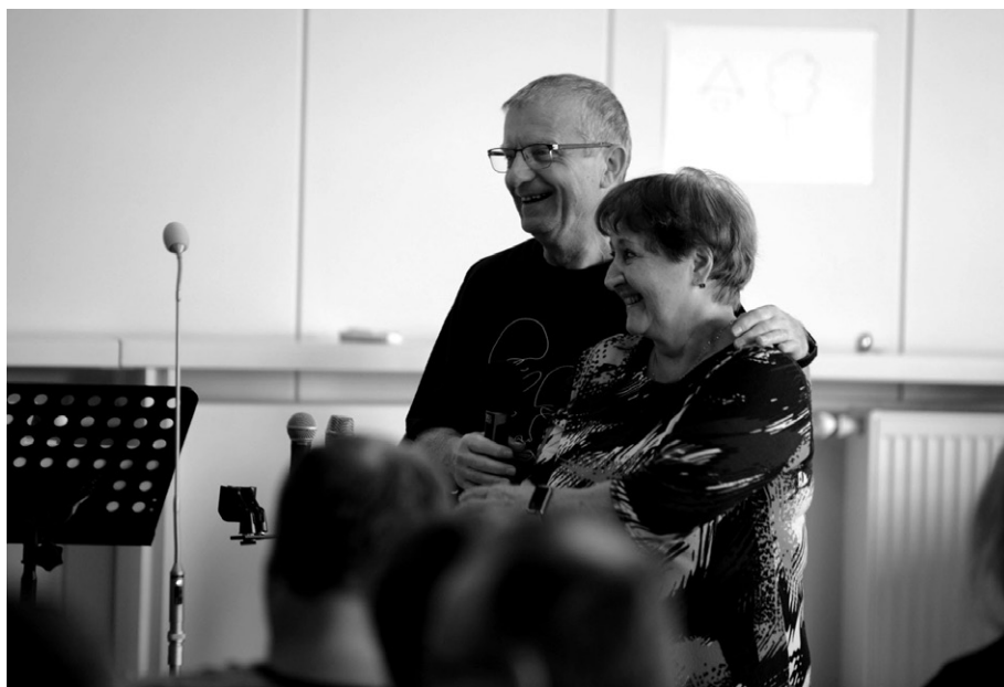
Manželia Budajovci na Konferencii Rodinného spoločenstva 2022