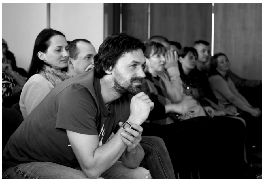
Konferencia Rodinného spoločenstva 2022, Tatranské Matliare