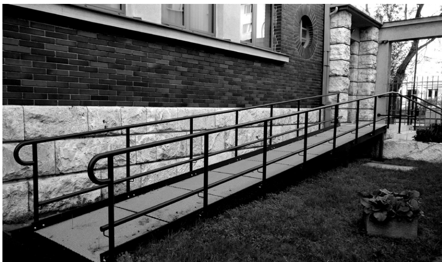
Rampa umožňuje bezbariérový prístup do kostola.