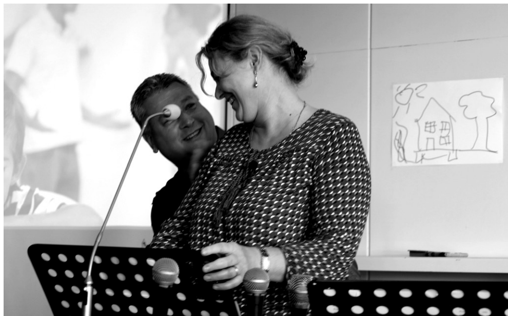
Na konferencii RoS slúžili prednáškami aj manželia Petrovci. Mládežnícke Služby Božie, 9. november 2022