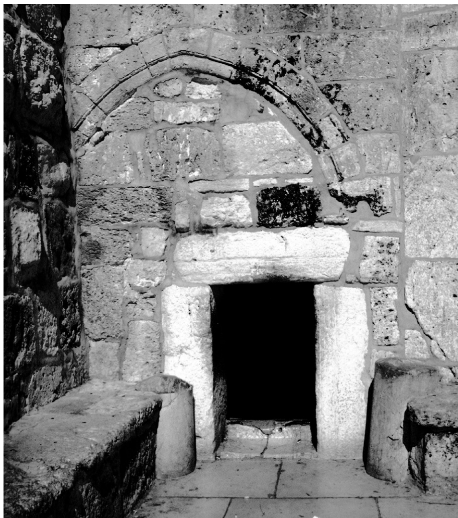
Vstup do baziliky Narodenia malými dverami Pokory

kadidelnice. Takí jednoducho sme: udalosť vtelenia sa stráca pod nánosom našich predstáv o Vianociach. Čo sme z nich len dokázali urobiť!