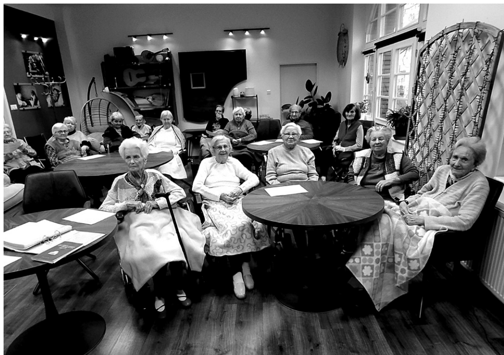
Ranná pobožnosť v SED Bratislava november 2022 Na Misijných dňoch ZD sa zúčastnili viacerí členovia nášho zboru.