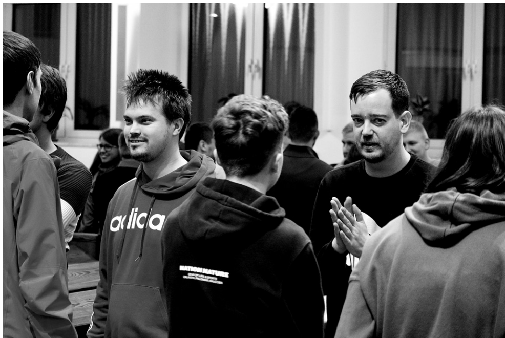
Mládežnícke Služby Božie, 9. november 2022, foto Eva Belláková