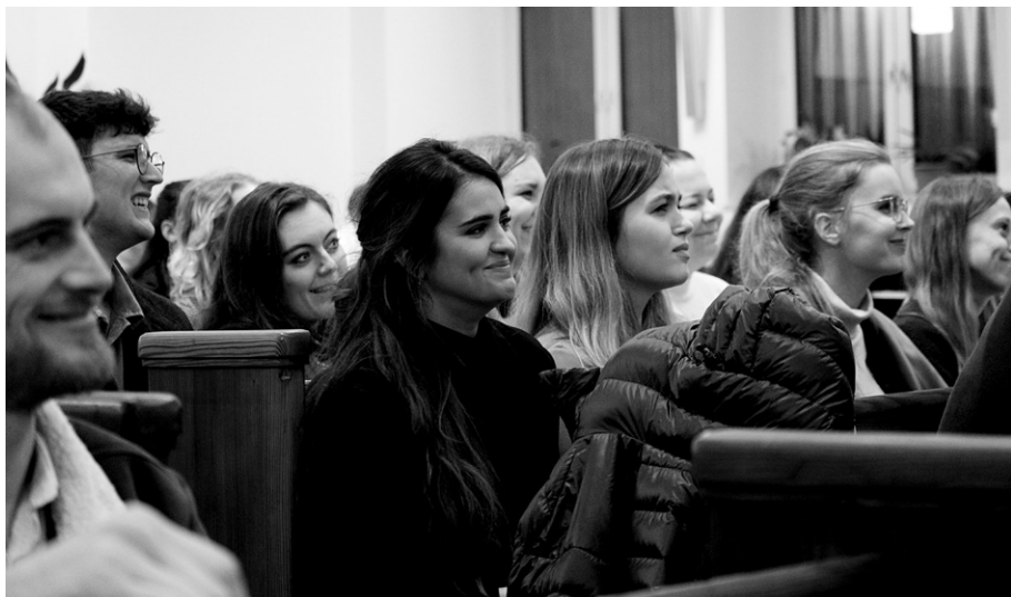
Mládežnícke Služby Božie, november 2022

tá naša viera živá, sa ukáže vo vyhrotených situáciách. Konflikty, nezdary a problémy. Ako zareagujeme?