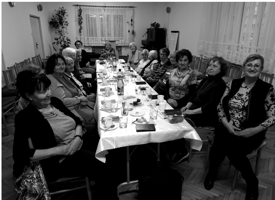
Stretnutie Klubu seniorov, november 2022

ktoré sa na pôde zboru stretáva každý týždeň a v rámci ktorého je okrem iného poskytovaný aj patientský koučing.