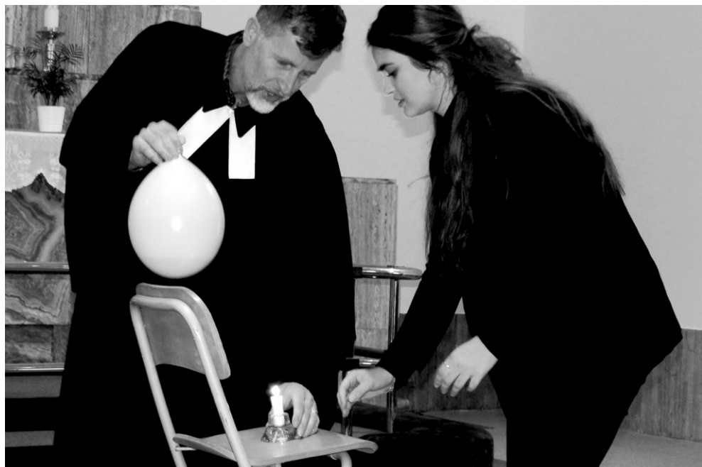
Mládežnícke Služby Božie, 9. november 2022, foto Eva Bachletová Pohybové cvičenia seniorov v Stredisku evanjelickej diakonie (SED) Bratislava, jeseň 2022