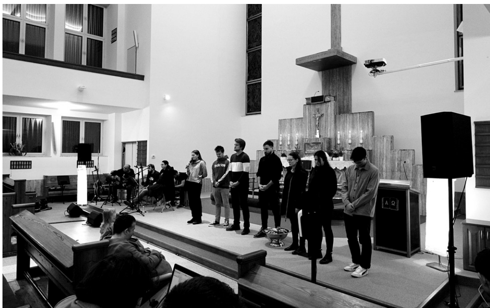
Mládežnícke Služby Božie, 9. november 2022