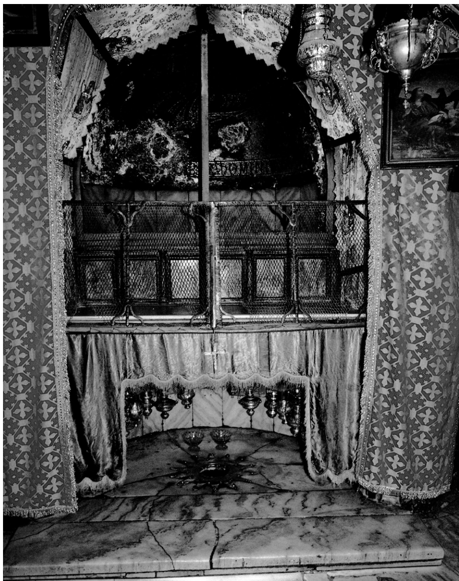
Bazilika Narodenia v Betleheme

Človek zrejme túži túto chudobu nejako „vylepšiť“ podľa svojich predstáv.