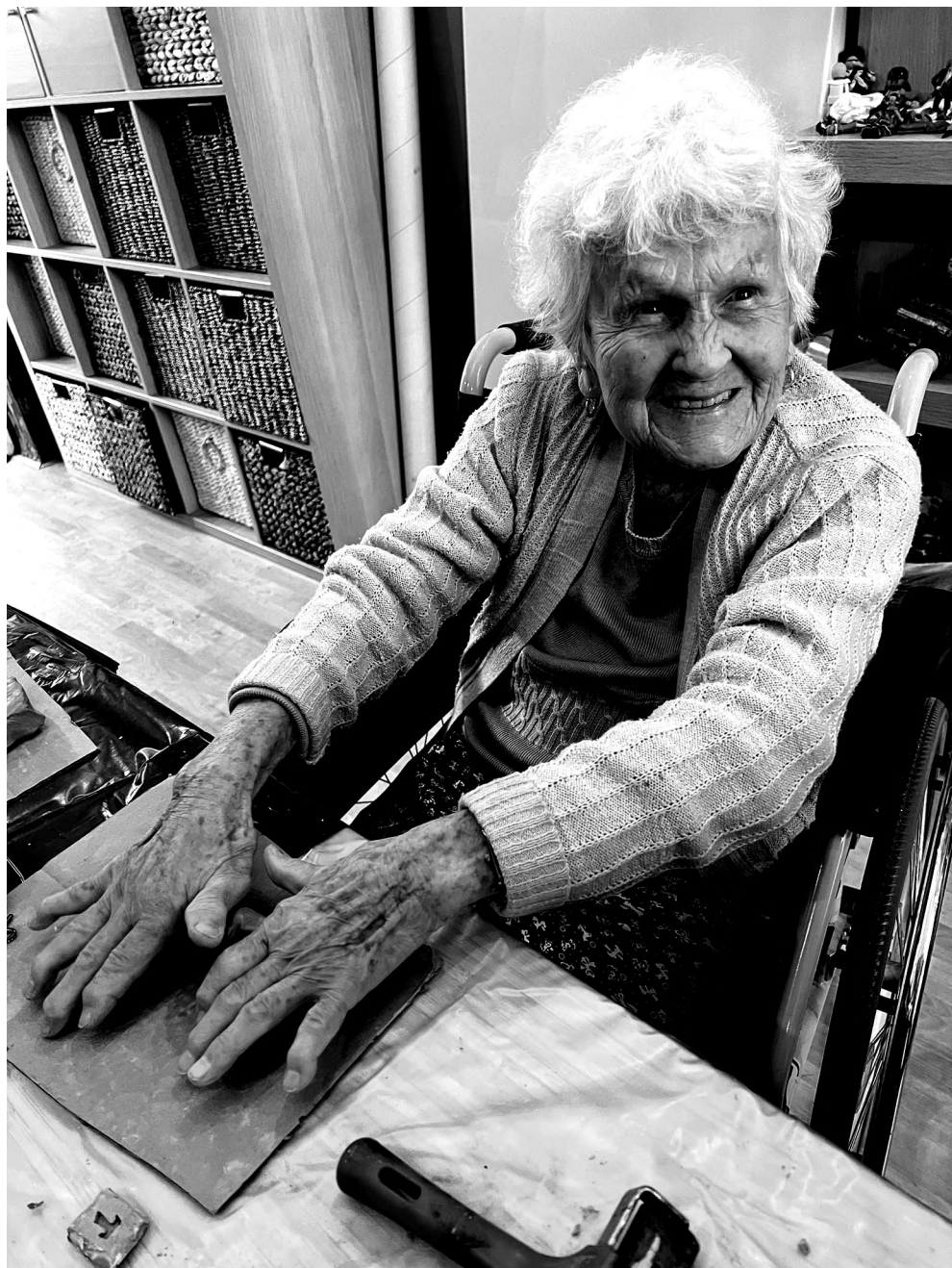
Seniori v Stredisku ev. diakonie Bratislava trávia svoj čas aktívne.