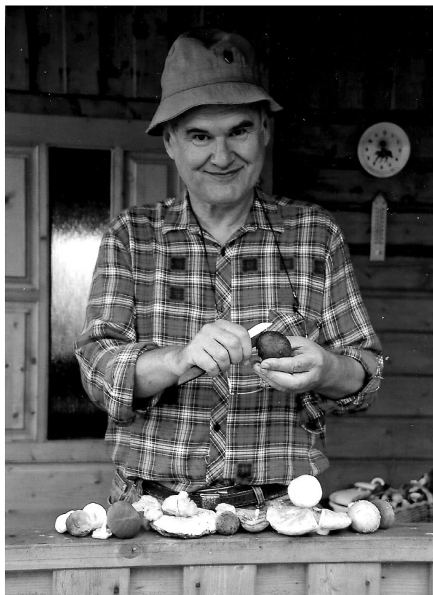
Na Važeckých lúkach

spoločnostiach (Datanet, Softline Services), napokon ako riaditeľ a štatutár Evanjelickej diakonie ECAV na Slovensku.