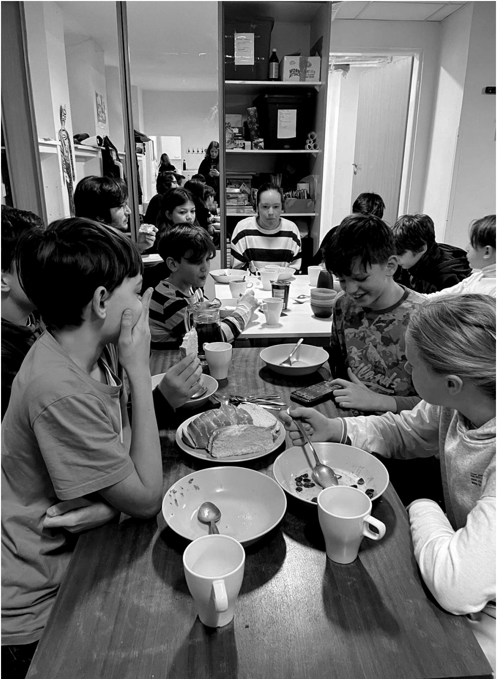
Noc dorastu na fare, november 2022